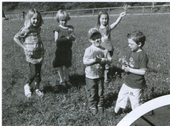
Einen Blumenstrauß für die Mama.