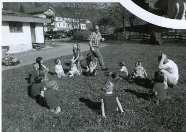
Auch die Eltern hatten sehr viel Spaß.